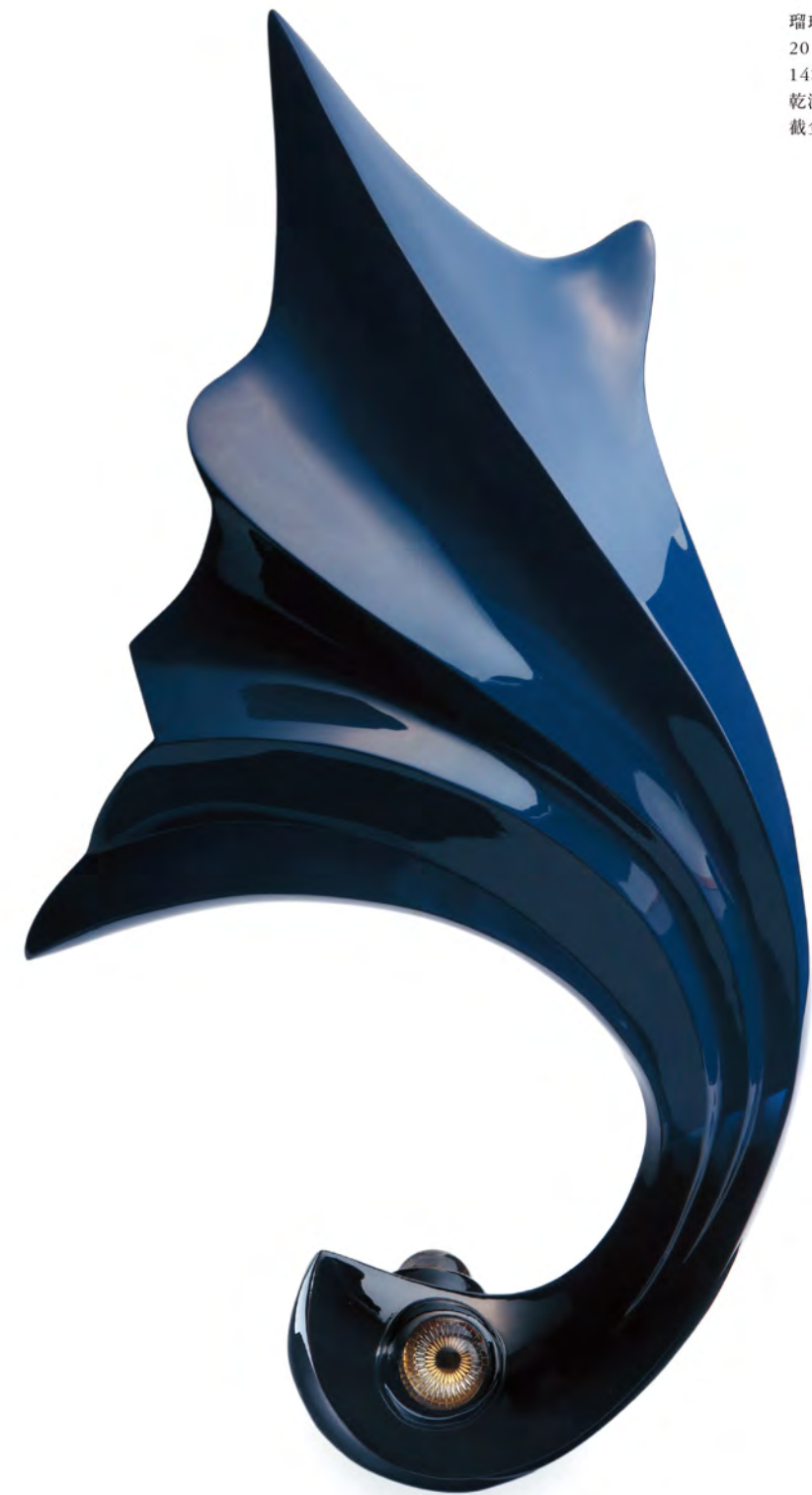
瑠璃のさかな 2019 14×30×52cm 乾漆、截金ガラス 截金ガラス:山本茜