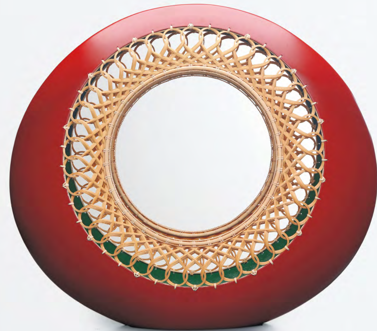
天目の船 2019 12×53.5×45cm 乾漆に竹 竹:四代田辺竹雲齋