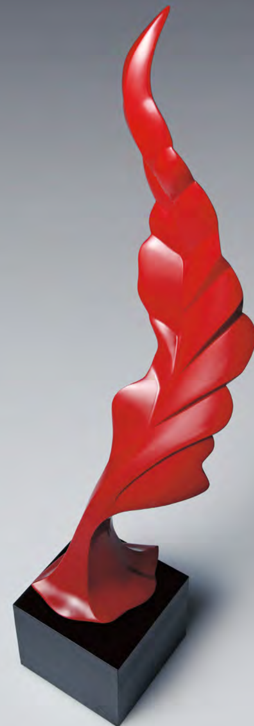
漣 - 楚楚 2018 25×16×51cm 乾漆に朱漆