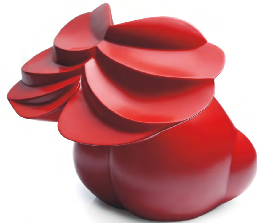
金魚 - ふわり 2019 20.5×24×18cm 乾漆に朱漆

むかしむかし、天井に吊られた瑠璃の水そうで、金魚を愛でたようです。 この空のさかなのお話しに、魅了されました。 丸みのかたちに、かさねやむすびを表現すると、 そこに、私なりの金魚ができました。 お月様やお日様やお山のあいまを、のんびり泳ぐ空のさかなに、 興味を持って頂ければ幸いです。