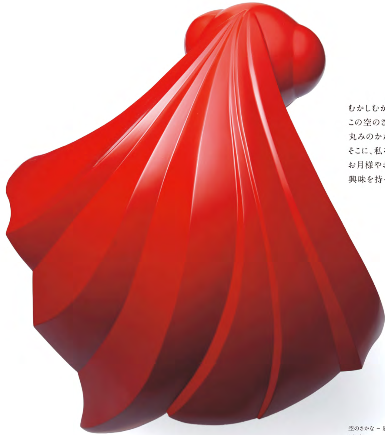
空のさかな - 風 2019 37×38×37cm 乾漆に朱漆

むかしむかし、天井に吊られた瑠璃の水そうで、金魚を愛でたようです。 この空のさかなのお話しに、魅了されました。 丸みのかたちに、かさねやむすびを表現すると、 そこに、私なりの金魚ができました。 お月様やお日様やお山のあいまを、のんびり泳ぐ空のさかなに、 興味を持って頂ければ幸いです。